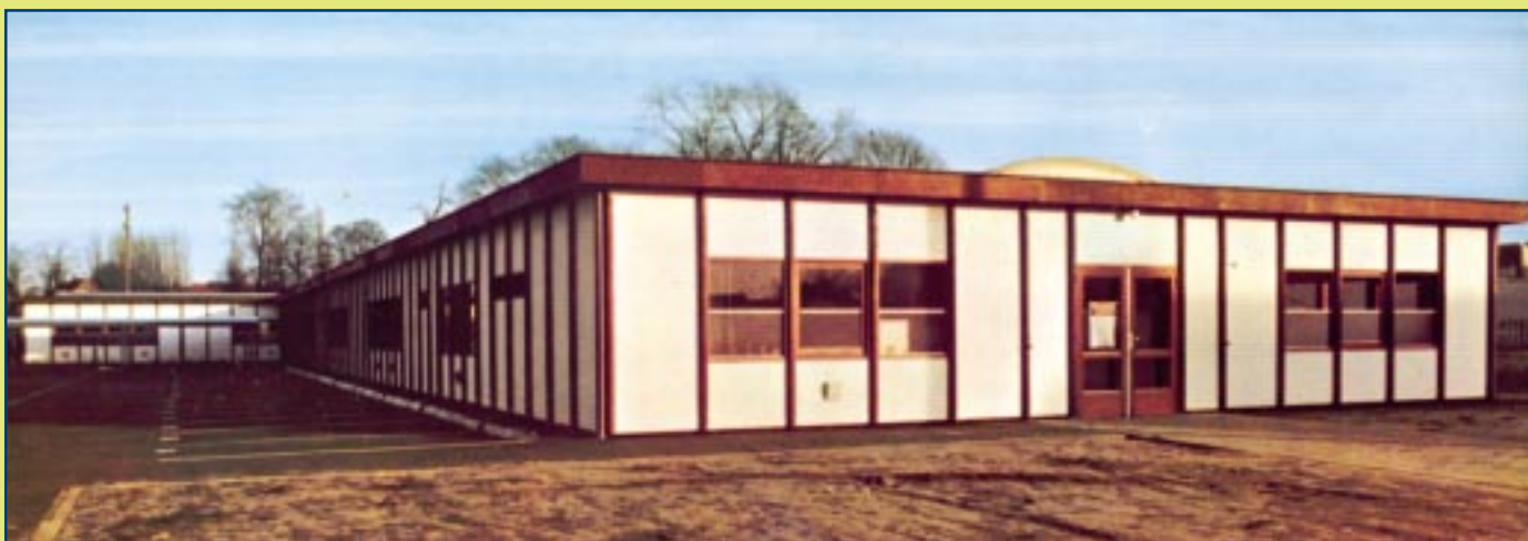
De prefab, het eerste onderdak van de Sociale Hogeschool Geel